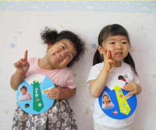
かわいい笑顔も一緒に