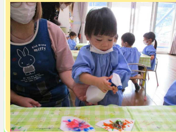
シュシュ、楽しいな～