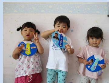
父の日のプレゼント