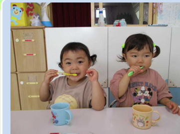
上手に磨けているかな？