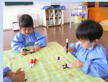
どんな目にしようかな？