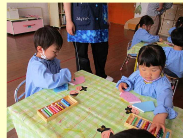
どんな模様にしようかな？